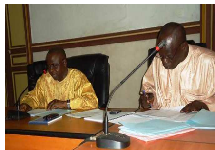
Réunion CoPil du 22 Août au Conseil Régional de St Louis

OS3 : Professionnaliser la gestion et le suivi des services d'eau potable, et améliorer les pratiques des ménages en matière d'hygiène et d'assainissement.