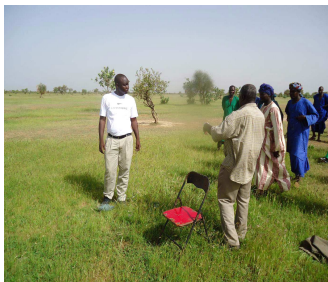
Visite du site de Wendou Diami par le Chef de projet

L'étude hydrogéologique pour l'implantation du forage de Wendou Diami a été réalisée par un Consultant sénégalais qui a estimé une profondeur de 172 m. Une étude topographique détaillée a été également réalisée avec un Bureau Sénégalais en vue de l'extension du réseau AEP de Mbane vers 3 villages.