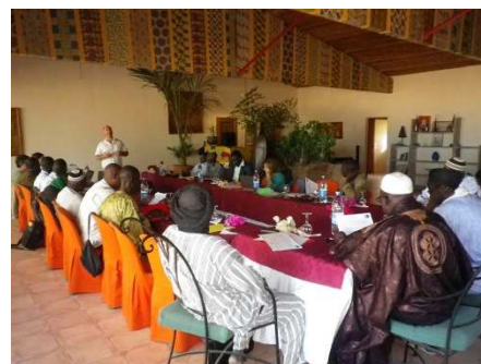
Journées d'échanges techniques à Saint-Louis

Les enseignements de ces deux journées alimenteront les réflexions des projets du Gret actuellement à l'œuvre dans la vallée du fleuve Sénégal : Aicha St Louis, Aicha Mauritanie et PaceaS.