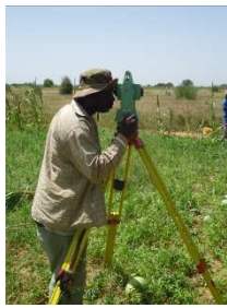
Levés topographiques à Mbane