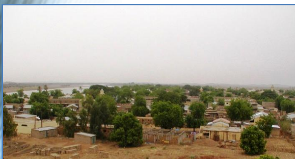
Un gros village au centre dense en bordure de Fleuve