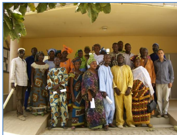
Le comité directeur de l'Association est composé de 33 membres délégués par les conseils de quartiers.