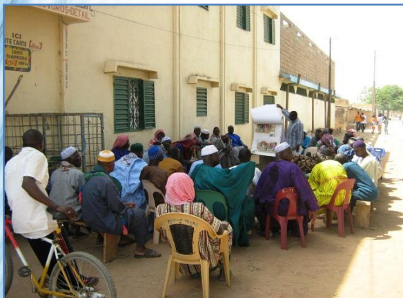
Les séances de sensibilisation dans les quartiers sont un préalable à la constitution de l'association des usagers.