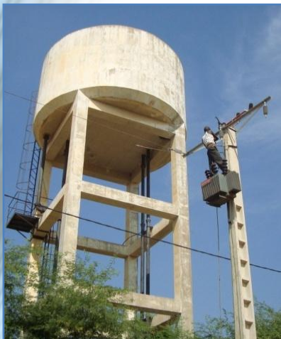
La ligne en moyenne tension créée par le projet permet de protéger les installations de pompage des baisses de tension.