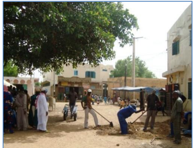
La réhabilitation et la modernisation du réseau préexistant ont permis de réparer de nombreuses fuites et de procéder au nettoyage et à la désinfection des canalisations ayant été hors service pendant près de 5 ans.