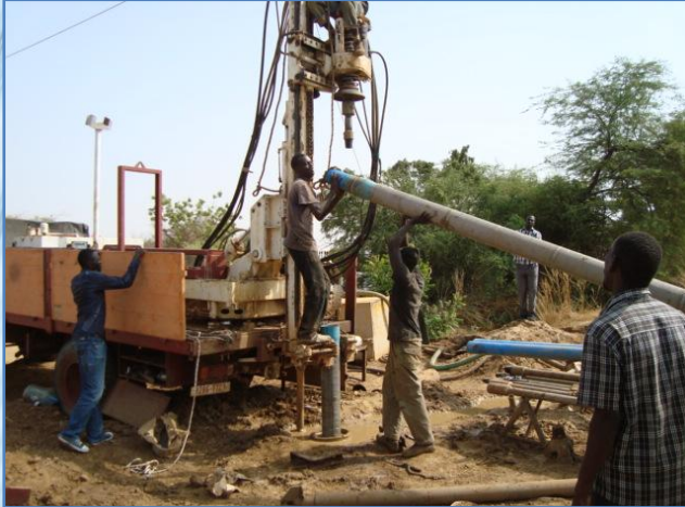
Avec l'appui du Gret, la Collectivité a également sélectionné l'entreprise pour la réalisation du nouveau forage complémentaire à Moudéry. Une étude hydrogéologique a permis d'identifier le site de ce nouveau forage.