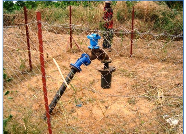
Le nouveau forage a été équipé avec une électropompe immergée de 18m 3 /h transmise à l'Asufor par le Gret. Ce forage permet de satisfaire la demande pour les 15 prochaines années.