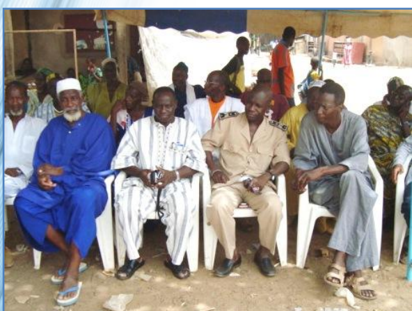
L'inauguration en présence du Sous-préfet, des services déconcentrés et du président de la communauté rurale a permis de présenter le nouveau gérant sélectionné par l'Asufor