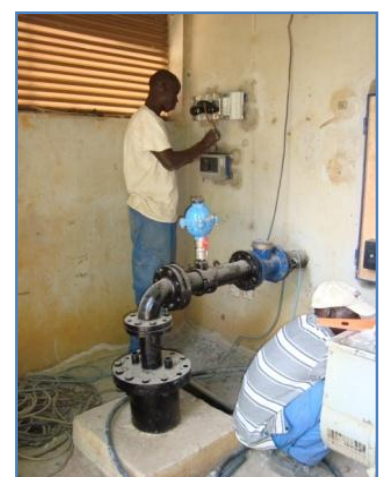
Les installations électriques installées par le projet permettent de contrôler les des 2 forages à partir d'un seul coffret de commande.