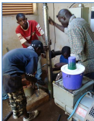
Le projet a procédé à la réhabilitation et la caractérisation du forage préexistant (6", 10m 3 /h).