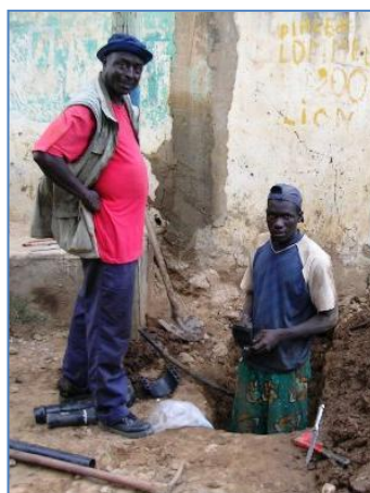
Le délégataire réalise les branchements privés pour tous les ménages demandeurs. Près de 250 branchements seront réalisés à terme.