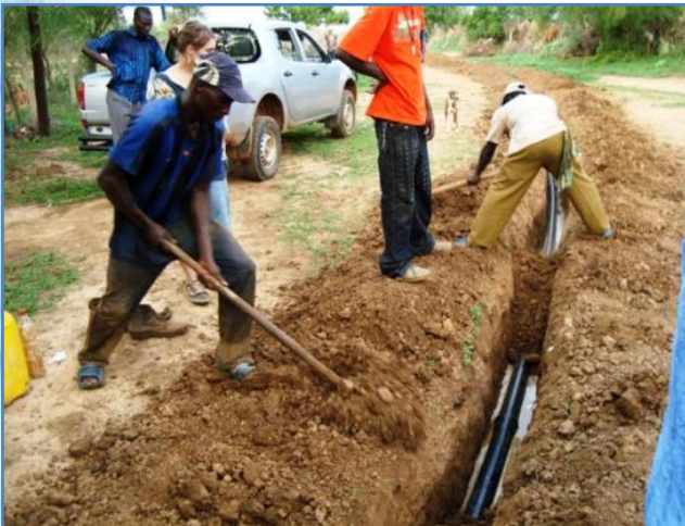
Le nouveau forage est raccordé au château d'eau sur une longueur de 350 mètres de canalisation en diamètre 110mm.